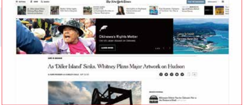
ニューヨークタイムス電子版に掲載された沖縄意見広告。Okinawa's Rights Matter 「沖縄の米軍基地問題」 End US-Japan Assault on Okinawa 「日本による沖縄の占領支配を終わらせよう!」 アメリカ広告全文は、ホームページでご覧になれます。 http://www.okinawaken.org/nytimes2017/